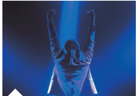
Passons à autre chose : Cie ZAOUM

Tarifs : 14€/7€ - Durée : 1h10 À partir de 15 ans.