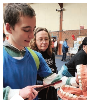
Hygiène bucco dentaire.