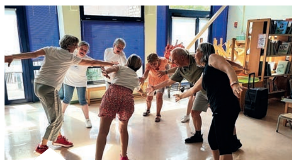
Yoga du rire

Yoga du rire : Deux séances sont prévues, les mardi 25 et samedi 29 mars, de 14h00 à 15h00 à l'espace Barbara (salle Lily Passion). Le rire s'apparente à un exercice corporel et les séances sont collectives. Les participants exercent leur enthousiasme,